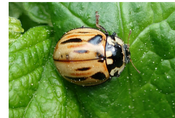
Isopirkko (Kuva Tomi Mynttinen Laji.fi CC BY 4.0)