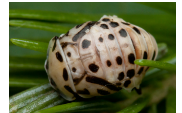
Isopirkko, kotelo