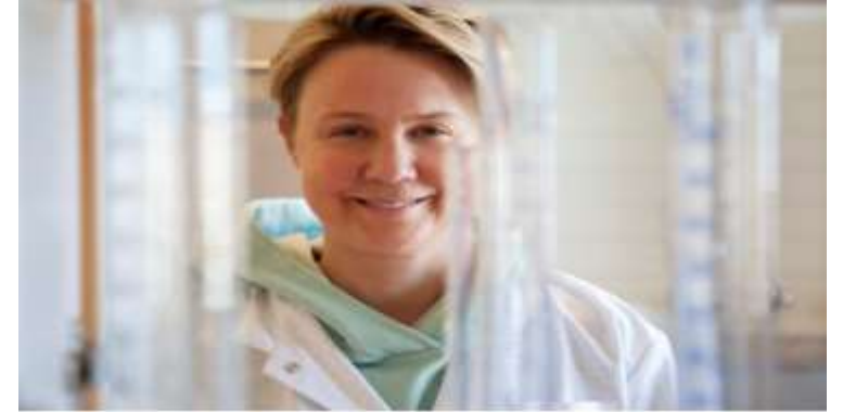
Jutut | 25.3.2022 | Kemiamedian toimitus

Yrityksen ja kalatalouden kehittämiseksi kalateollisuus on valinnut halla-ruokatehtaan. Ruokatehtaan perustaja on valinnut halla-ruokatehtaan, jolla on mahdollisuus kehittää kotimaisia villikalatuotteita. Yrityksen on tarkoitus aloittaa toimintansa Suomessa.