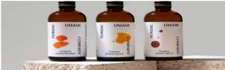
Nestemäistä kasvipohjaista umamia.

Solar Foodsin soleiini-proteiinin tuotanto on ollut pienimuotoista. Jatkossa sitä aiotaan tuottaa yhtiön ensimmäisessä kaupallisessa tuotantolaitoksessa Vantaan Vehkalassa.