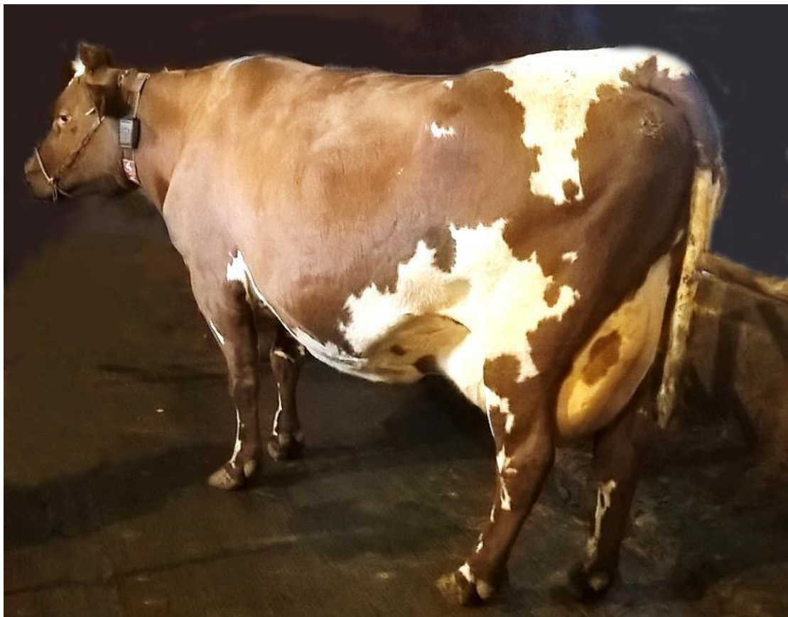
Kuva 1: Puhdas

Valokuvia voi soveltuvin osin hyödyntää myös muiden eläinten likaisuuden arvioinnissa.