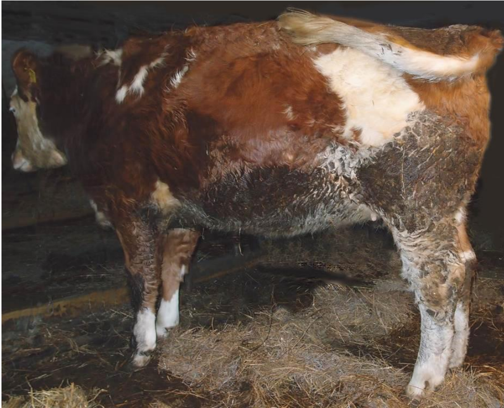
Kuva 3 Likainen