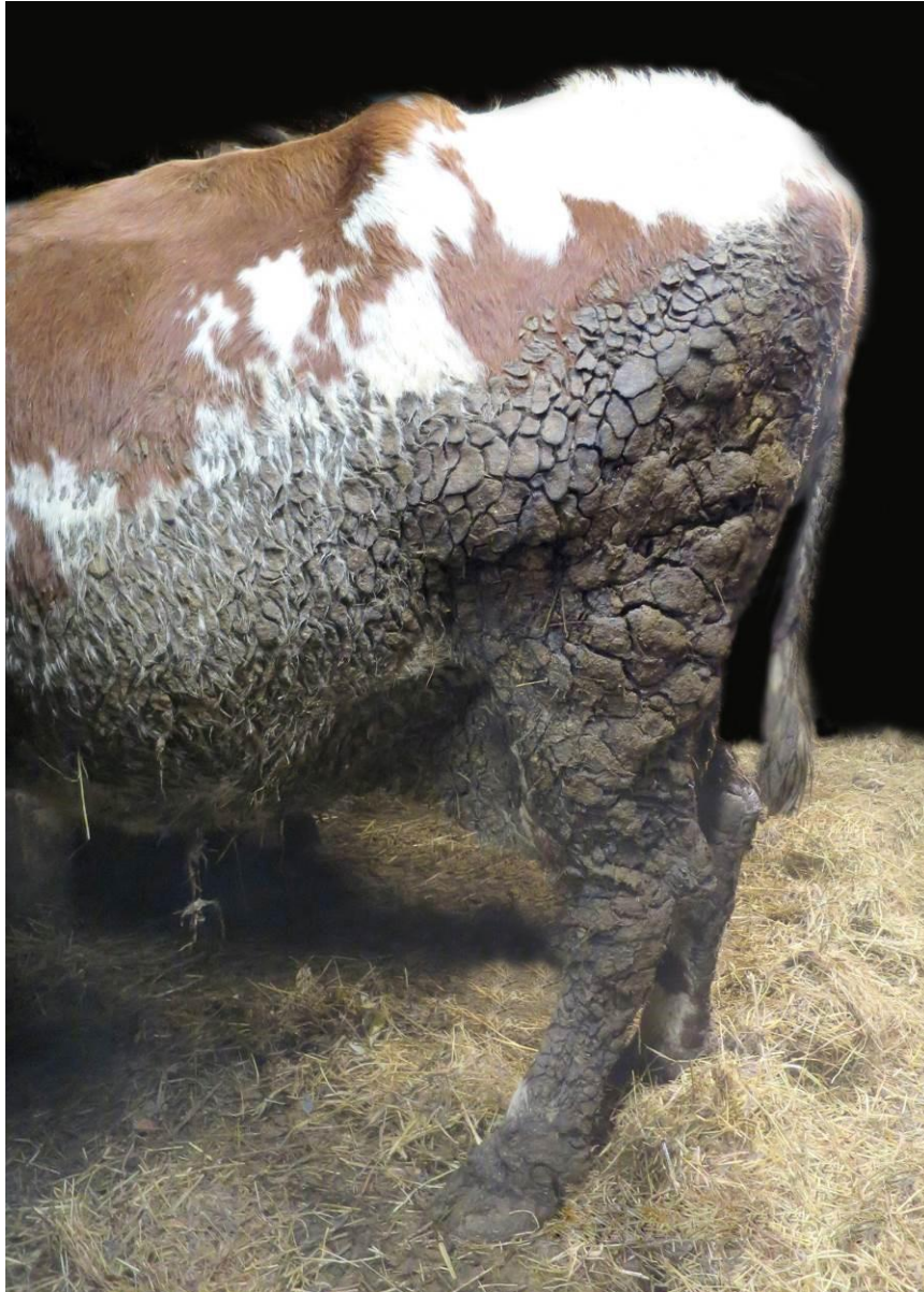
Kuva 6 Erittäin likainen