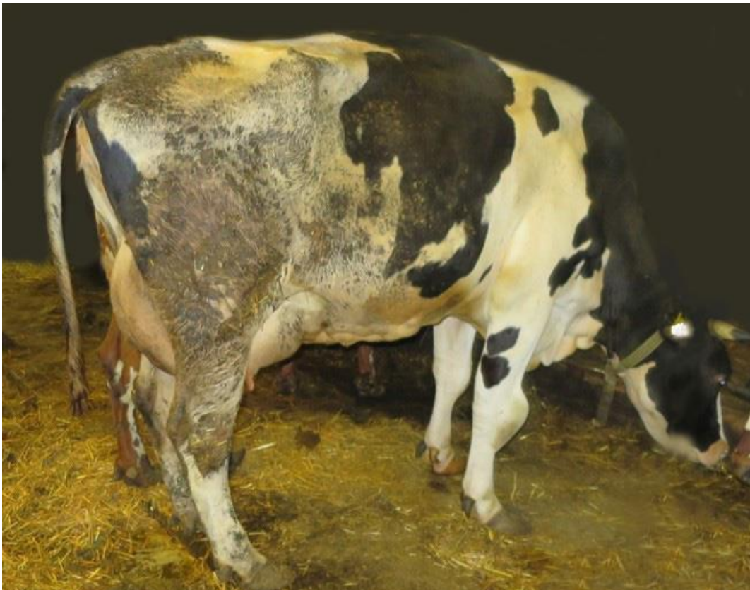
Kuva 4 Likainen