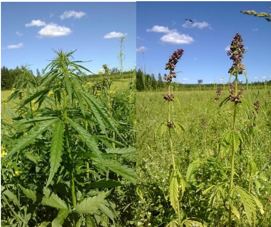
Kuva 1. Vasemmalla öljyhampun (Finola) emikukinto ja oikealla hedekukinto.

Näytteet hamppukasvustoista kerätään komission täytäntöönpanoasetuksen (EU) N:o 639/2014 liitteen III mukaisesti noudattamalla käytäntöä A. Jokaiselta lohkolta tulee ottaa oma näyte, johon kerätään 30 senttimetrin mittainen osa 50 valitusta kasvista . Kasvissa on oltava vähintään yksi emikukinto (ks. kuva 1). Näytteet on kerättävä päiväsaikaan. Keruu on tehtävä järjestelmällisesti siten, että lohkokosta saadaan edustava näyte. Näytteitä ei tule kuitenkaan kerätä lohkon reunoilta. 14