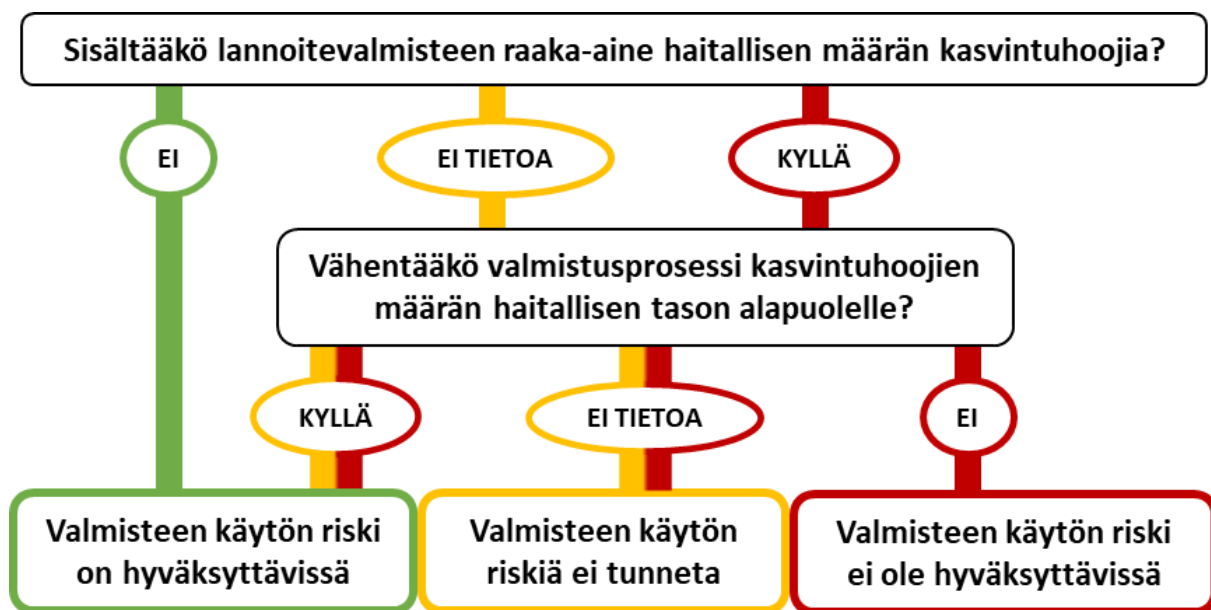
Kuva 4. Kasvipöeräistä raaka-ainetta sisältävän orgaanisen lannoitevalmisteen lannoitekäytön arviointi. Jos raaka-aine sisältää muita kuin viljeltävää kasvilajia vaurioittavia kasvintuhoojia, niiden säilyminen maassa on huomioitava ennen kuin isäntäkasveja aletaan viljellä.

Kirjallisuustutkimuksen tulosten perusteella perunateollisuuden sivuvirtojen käyttöön kierrätyslannoitteena sisältyy kasvinterveysriskejä nykyisistä kasvinterveyslainsäädännön, lannoitelainsäädännön ja Euroopan perunakauppaliiton edellyttämistä toimista huolimatta. Näiden riskien suuruuksia ei ole olemassa olevan tiedon perusteella kuitenkaan voida arvioida kaikkien tuhojien osalta. Merkittäviä tietopuutteita ovat tällä hetkellä se mikä on haitallinen määrä tuhojia (raja-arvo sille, onko kasvinterveysriski hyväksyttävissä vai ei), sisältävätkö raaka-aine ja sen mukana tuleva maa-aines haitallisen määrän tuhojia ja kuinka hyvin lainsäädännön edellyttämät tai muutkaan käytössä olevat käsittelyt vähentävät tuhojia suhteessa haitalliseen määrään? Jos näistä seikoista edes osa tiedettäisiin, voisi perunateollisuuden sivutuotteiden lannoitekäyttöä arvioida kuvassa 4 esitetyn yksinkertaisen kaavion perusteella.