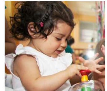
CONSUMER GOODS AND RETAIL