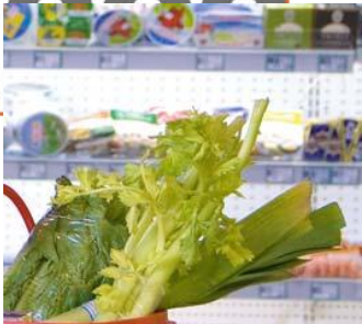
AGRICULTURE AND FOOD