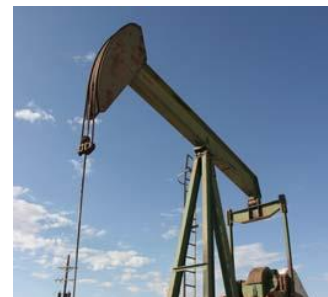
OIL AND GAS