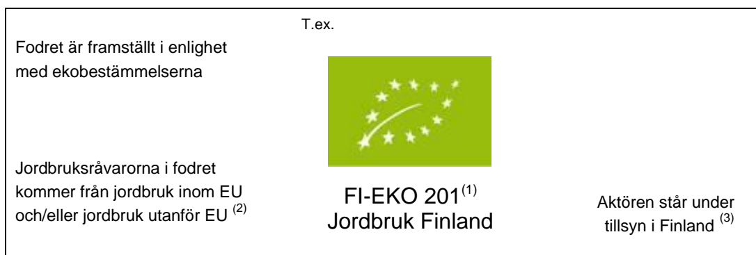
Bild 2: Användning av gemenskapslogotypen, lövlogon, för foder för produktionsdjur

(3) Dessutom kan man komplettera med landets namn om alla råvaror som ingår i produkten är producerade i det landet.